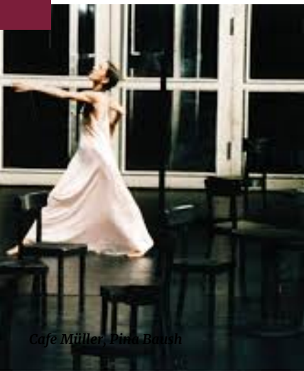
Cafe Müller, Pina Bausch

17-18 Octubre 21-22 Noviembre 11-12 Diciembre 16-17 Enero 20-21 Febrero 13-14 Marzo 17-18 Abril 22-23 Mayo 19-20 Junio