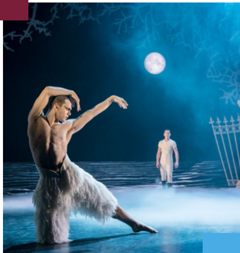
El lago de los cisnes, de Matthew Bourne

Esta titulación destaca en el panorama internacional por su enfoque multidisciplinar y vanguardista, ya que no se limita al texto dramático convencional, sino que evalúa la madurez intelectual, la solidez teórica y el virtuosismo práctico del artista para fusionar lenguajes contemporáneos como el teatro físico, la danza teatro, la creación colectiva, el canto y el diseño del espacio escénico.