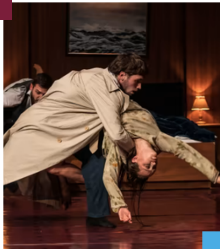
The Missing Door, Peeping Tom

Para completar el montaje final, en el que desarrollarás una pieza personal de una duración aproximada de 20 minutos, se complementarán estas fechas con una semana completa en Julio: Las fechas serán del 5 al 11 de Julio.